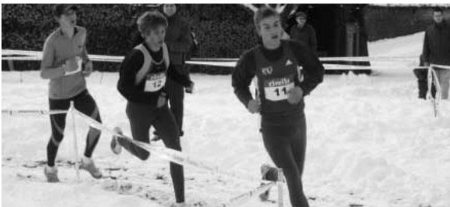
Drei Männer im Schnee ...

Das Januar Kältehoch schien sein Zentrum über Affoltern zu haben.