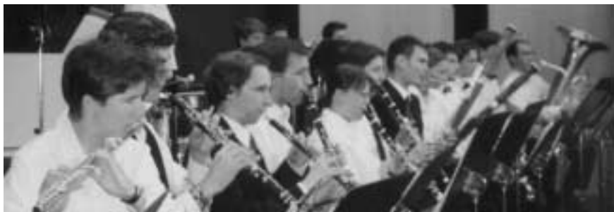
Petra als Musikerin im Orchester ...

gen Aufgabenbereichen ihrer Stelle und den Freiheiten, diese auszugestalten, erzählt.