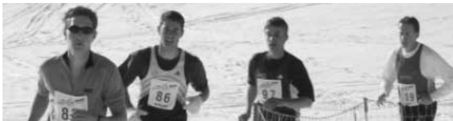
Viel Schnee auch in Netstal

Ziel verteidigte und damit seinen ersten Crosssieg und zugleich den Sieg in der Gesamtwertung feierte.