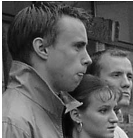
Die Prenzlauer warten auf die UstermerInnen